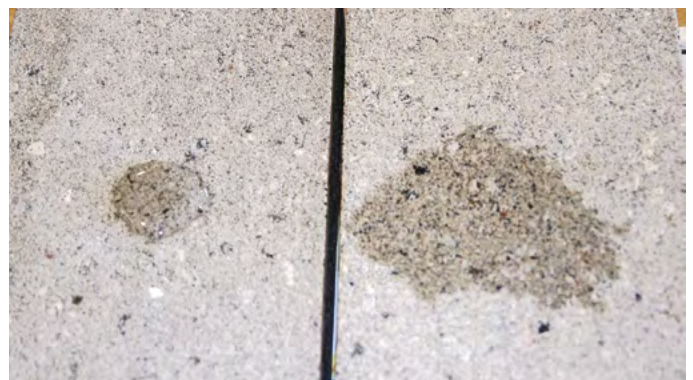
En behandlet og en ubehandlet overflade kan skelnes, når der placeres en vanddråbe på overfladen

Dette medfører dog også, at der ofte er en vis forskel i farve og glans på behandlede og ubehandlede overflader, fordi imprægneringen virker vædende (giver et udseende som en våd betonoverflade). Overfladen bliver mørkere, og farver og struktur bliver tydeligere. Der er også forskel på hvor holdbare imprægneringsmidler er, fx over for UV stråling.