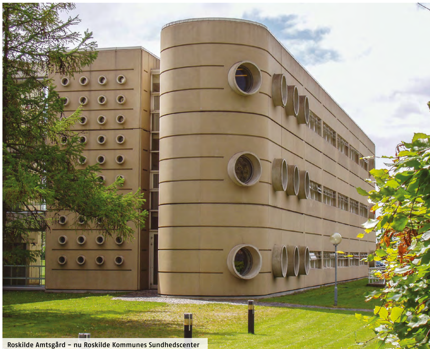
Roskilde Amtsgård – nu Roskilde Kommunes Sundhedscenter

Flere dele af denne vejledning indeholder informationer fra publikationen "Vedligehold af Betonkonstruktioner" fra www.synligbeton.dk – Vedligehold af synlige betonoverflader. Her er der mere detaljeret information om æstetisk holdbare betonoverflader.